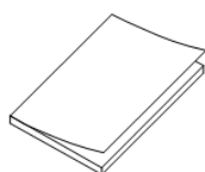
说明书 (× 1)