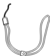
挂绳 (× 1)