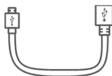
USB 数据线 (× 1)